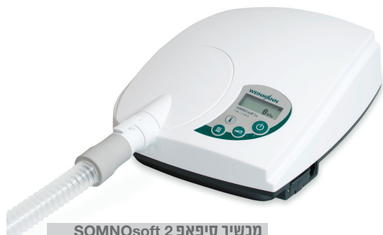
מכשיר סיפאפ SOMNOsoft 2

מכשיר סיפאפ בלחץ קבוע קטן, שקט ביותר ונוח לשימוש כולל כרטיס זיכרון הפחתת לחץ בנשיפה כיבוי והדלקה אוטומטיים מעשיר לחות אינטגרלי כאופציה