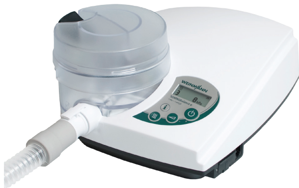
מכשיר סיפאפ SOMNObalance e

מכשיר סיפאפ בלחץ משתנה (אוטומטי) קטן, שקט ביותר ונוח לשימוש כולל כרטיס זיכרון הפחתת לחץ בנשיפה כיבוי והדלקה אוטומטיים מעשיר לחות אינטגרלי