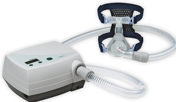
מכשיר סיפאפ 20E

מכשיר סיפאפ בלחץ קבוע קטן, שקט קל ונוח לשימוש, כולל פריקת נתונים ואופציה לחיבור מעשיר לחות.